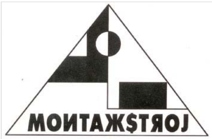
Logo kazališne skupine Montažstroj

'To je virtualna rasprava o kazalištu, odnosno to je početak rasprave o tome kakvo kazalište očekujemo. Jesu li te poruke spam, tretira li ih netko kao spam, ovisi o osobnom doživljaju onoga tko ih je primio', kazao je Šeparović.